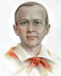
МАРАТ КАЗЕЙ 14 ЛЕТ