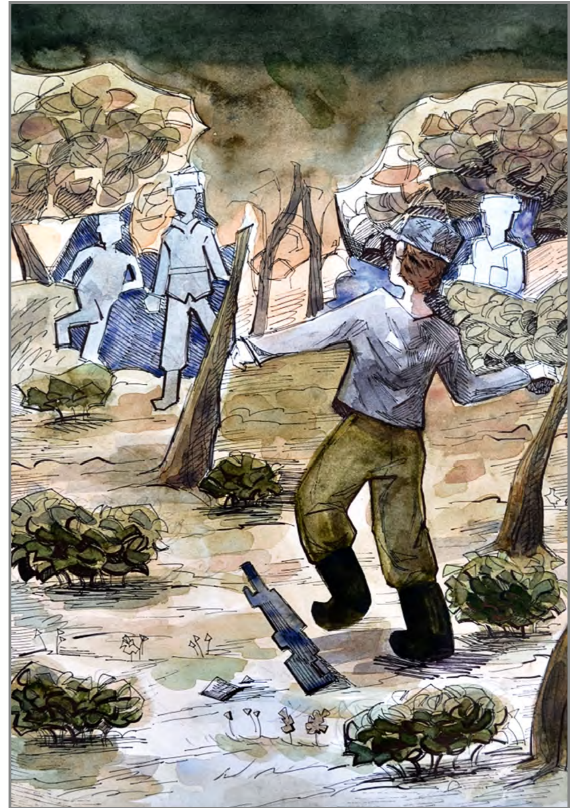
Скрябина Софья, 16 лет

Проснулся я от громкого шёпота командира, подскочил сразу.