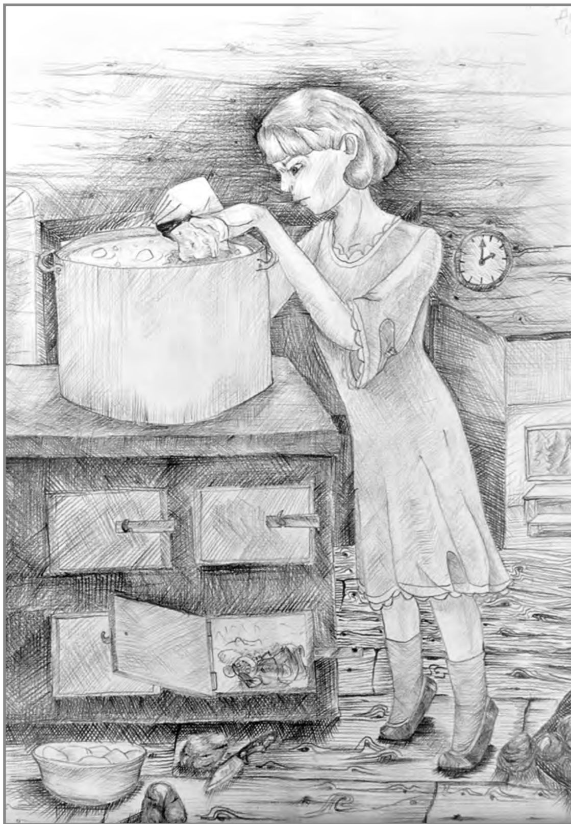
Коваль Дарья, 16 лет

«Я высыпала белый порошок в суп. — Держитесь, гады!»