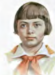
ЗИНА ПОРТНОВА 17 ЛЕТ