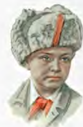
ЛЁНЯ ГОЛИКОВ 16 ЛЕТ