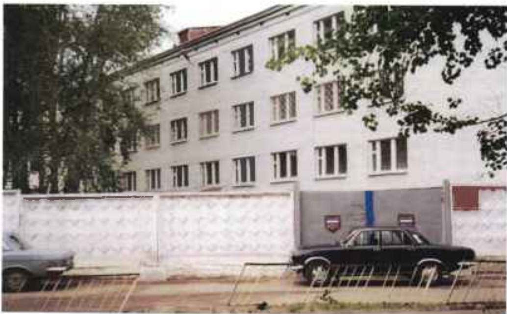
Здание военного комиссариата Республики Коми. 1996 г.

В 1996 году военный комиссариат подвергается проверке комплексной комиссией округа под руководством начальника штаба округа генерал-лейтенанта Шпак Г.В. и оценивается на «хорошо» 4 .