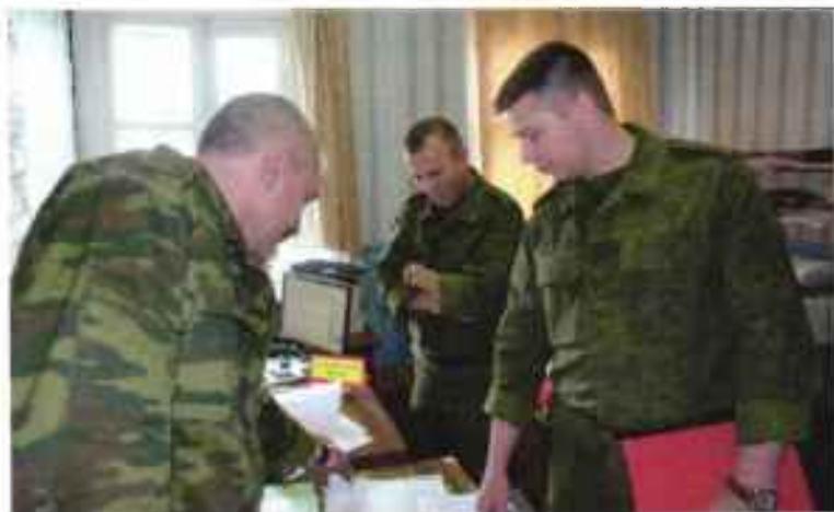
Представители штаба ЗВО проводят проверку воинского учета и оповещение мобилизационных ресурсов в МО МР «Корткеросский».

В связи с реорганизацией Вооруженных Сил, в ноябре 2014 года на основе Северного флота было создано Оперативное стратегическое командование – «Северный флот», который, по сути, стал пятым военным округом Вооруженных Сил России.