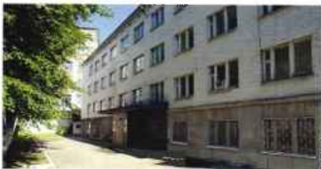
Военный комиссариат Республики Коми. 1996 г.