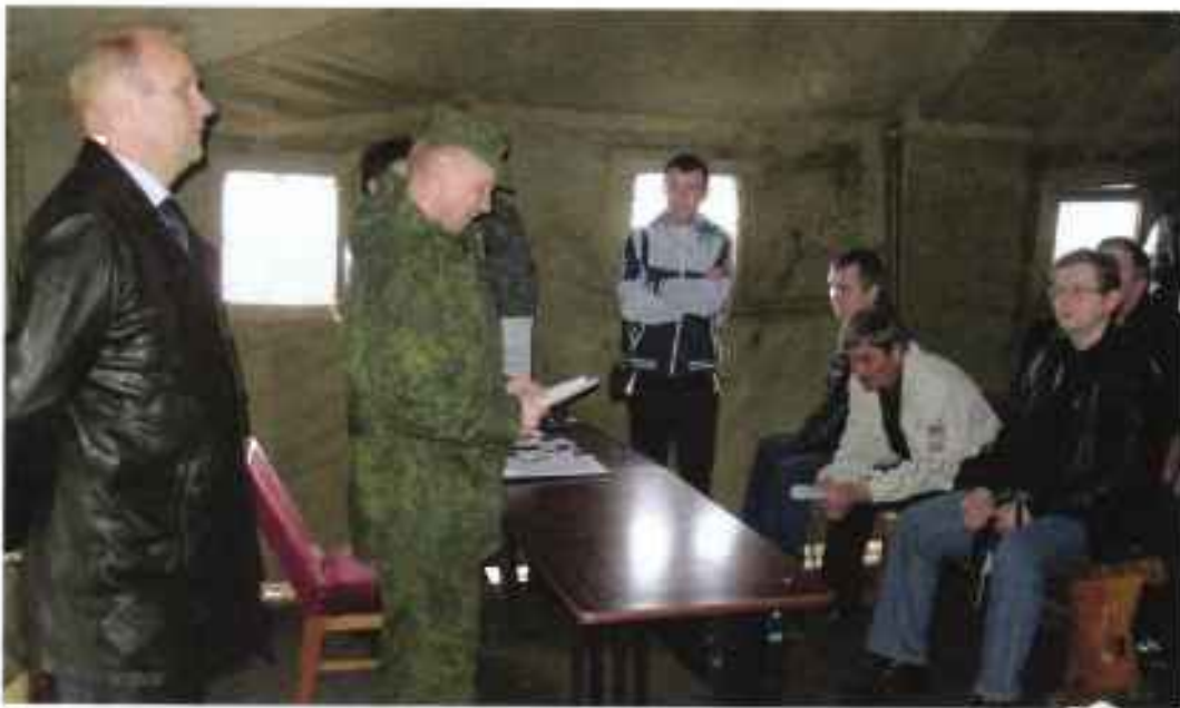
Пункт сбора граждан, призванных на военные сборы, при войсковой части.

В администрациях сельских поселений Приозерный и Маджа Корткеросского района проведена проверка штабов оповещения и пунктов сбора муниципальных образований. На базе отдела Княжпогостского района развернут пункт сбора граждан, пребывающих в запасе.