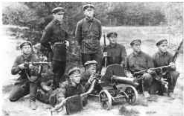
На стрелковой подготовке. В. Чов. 1930 г.

С переходом на территориальную систему комплектования и резким сокращением военных комиссариатов к 1930 году заметно снизились темпы ликвидации неграмотности, физической готовности и оздоровления призывного контингента. Так, за 4 года (с 1926 по 1930 гг.) грамотность призывников выросла только на 4%, оздоровительные мероприятия проведены на 40%, физическая годность в строй составила 59% 5 .