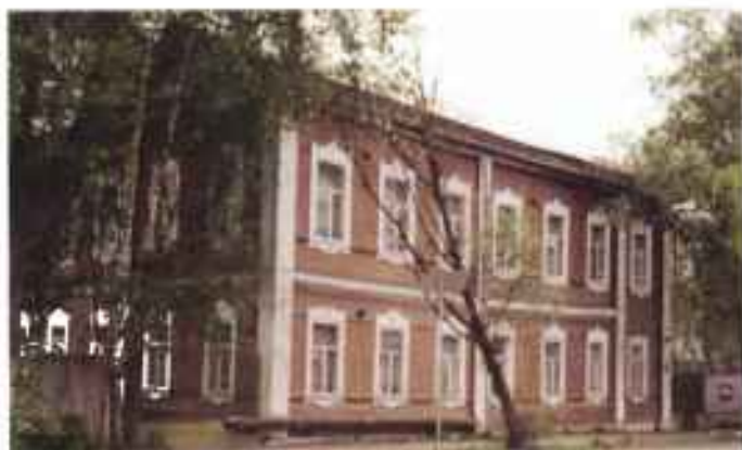
Здание военного комиссариата республики, бывший дом купца В.П. Комлина (Постройка 1902 г.)

Война в Чечне продолжалась до 31 августа 1996 г. Она сопровождалась террористическими актами за пределами Чечни (Буденновск, Кизляр). Фактическим итогом кампании стало подписание 31 августа 1996 г. хасавюртовских соглашений.