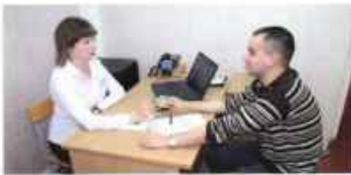
Оформление банковской карты призывника.

Благодаря настойчивой и планомерной работе и тесному взаимодействию с местными органами власти военному комиссариату удалось решить вопросы с получением новых помещений для военных комиссариатов. Так, в эти годы получили новые благоустроенные здания военные комиссариаты Троицко-Печорского, Усть-Куломского, Удорского районов, военный комиссариат города Ухты. Сделано много, но еще больше предстоит сделать в будущем.