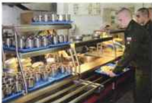
Столовая, «шведский стол».

На республиканском сборном пункте проведена большая работа по улучшению социально-бытовых условий для призывников. Проведен капитальный ремонт всех помещений. Оборудованы одноярусные спальные места в комнатах на 10 человек.