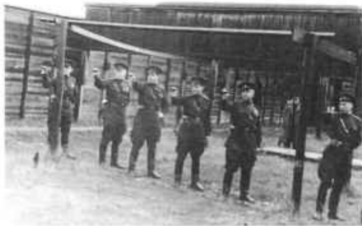
Офицеры военного комиссариата республики на занятиях по огневой подготовке, 1962 г.

Важно отметить такой факт, что на протяжении многих десятилетий своего существования военные комиссариаты нашли должное взаимопонимание с местными органами власти в деле реформирования своих структур в соответствии с административным делением республики. По крайней мере, примеров разногласия нет. Руководство автономии всегда