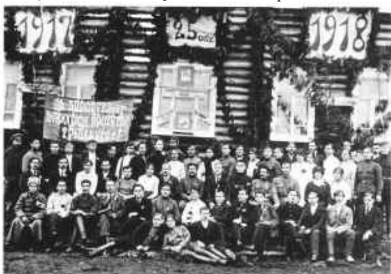
Усть-Сысольский волостной военный комиссариат. 1918 г.

Для обеспечения продвижения своих войск на главных направлениях интервенты и белогвардейцы начали развивать боевые действия по рекам