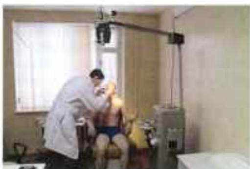
Медицинский осмотр на сборном пункте.

На каждом этаже предусмотрены душевые кабины и туалеты. Все призывники обеспечены регулярным трехразовым питанием в клубе-столовой, где для них предусмотрен «шведский стол» и буфет. За всеми призывниками установлен медицинский контроль, ежедневно медицинскими работниками осуществляется замер температуры. Для получения вещевого имущества, подгонки обмундирования оборудован вещевой склад. Одним из новшеств, введенных в работу военного комиссариата в последние годы, является обеспечение призывников персональными элек-