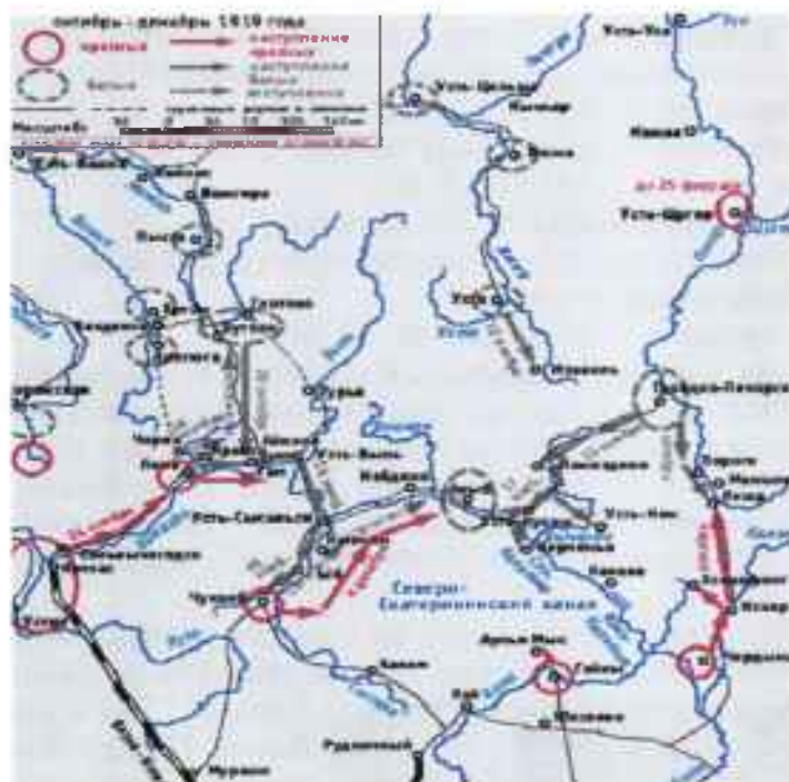
Схема боевых действий (октябрь–декабрь 1919 г.)

Ареной первых вооруженных столкновений гражданской войны в Коми крае была территория Печорского уезда.