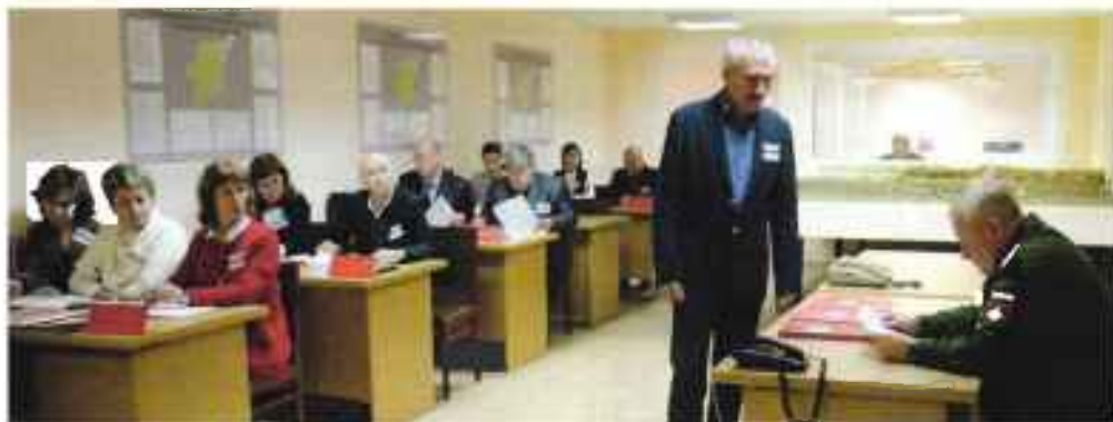
Участие личного состава военного комиссариата РК в совместных стратегических учениях «Запад-2017».

уровень работу призывных комиссий и все мероприятия, связанные с призывом граждан на военную службу.