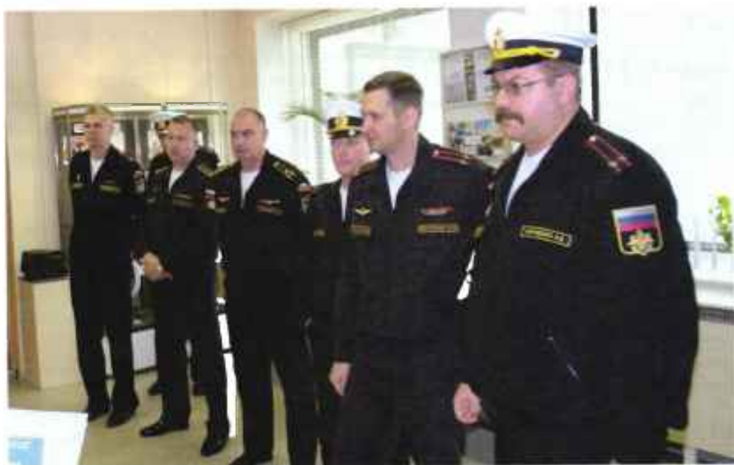
Комиссия штаба Северного флота по приему военного комиссариата Республики Коми в состав Северного флота. Сыктывкар, август 2015 г.

женных Силах России с 1 августа 2015 года военный комиссариат Республики Коми был выведен из состава Западного военного округа и совместно с военными комиссариатами Архангельской и Мурманской областями включен в состав Северного флота.