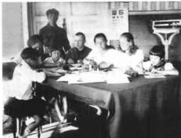
Облвоенкомат. 1924 г. Занятие в ликбезе.

Надо отметить, что как жители, так партийные и исполнительные органы автономии были заинтересованы в укреплении Красной Армии и чтобы мужское население проходило службу. На бюро, заседаниях исполкомов неоднократно поднимались вопросы подготовки молодежи к службе, повышения ее грамотности.