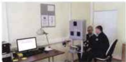
Оформление персональной электронной карты призывника.

тронными картами по программе «Паспорт» и индивидуальными банковскими картами, на которые им будет перечисляться денежное довольствие.