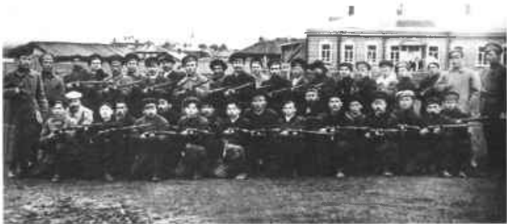
Первая рота всевобуча и сотрудники Усть-Сысольского волостного военкомата. 1918 г.

Базарная площадь (ныне пересечение ул. Кирова и Куратова).