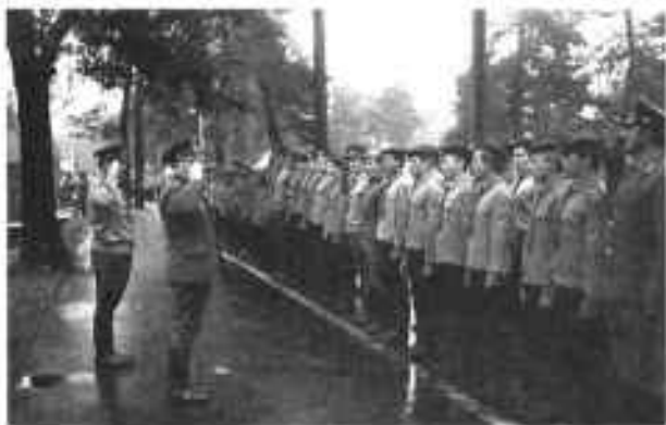
Лагерный сбор военно-патриотических отрядов. 1983 г.