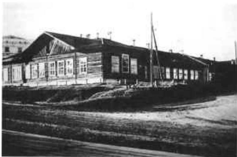
Первое здание Усть-Сысольского уездного военного комиссариата автономной области Коми. 1922 г. (На месте нынешнего Дома быта в г. Сыктывкаре).