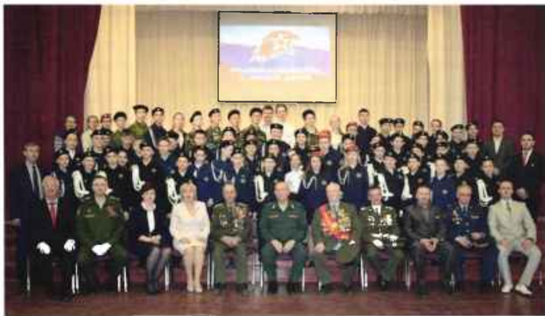
Торжественное мероприятие, посвященное приему школьников в ВПОД «Юнармия». Сыктывкар, 2017 г.

Сегодня юнармейцы принимают самое активное участие в общественной жизни городов и районов республики, помогают одиноким людям, больным и немощным. В их поле зрения ветераны войны, боевых действий, Вооруженных Сил, труженики тыла военных лет. Хорошие центры по патриотическому воспитанию работают в Помоздино, Визинге, Ухте. В 2018 году в движение вольются все общеобразовательные школы, а также большинство военно-патриотических клубов и организаций.