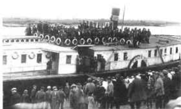
с. Усть-Кулом. Отправка призывников, 1933 г.

подготовки молодежи к призыву. Было предложено в августе месяце провести совещание-семинар с врачами, выделенными для работы в призывных комиссиях. Начало призыва по области признать желательным с 20 сентября, о чем было предложено поставить вопрос перед Военным советом округа.