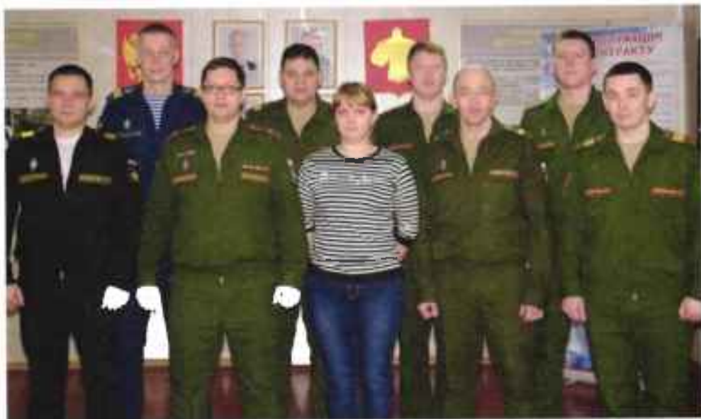
Пункт отбора на военную службу по контракту (3 разряда) (г. Сыктывкар)

Временным типовым положением определялись задачи, функции, порядок обеспечения и взаимодействия пунктов отбора с органами исполнительной власти субъектов Российской Федерации, органами местного самоуправления муниципальных образований и военными комиссариатами субъектов Российской Федерации.